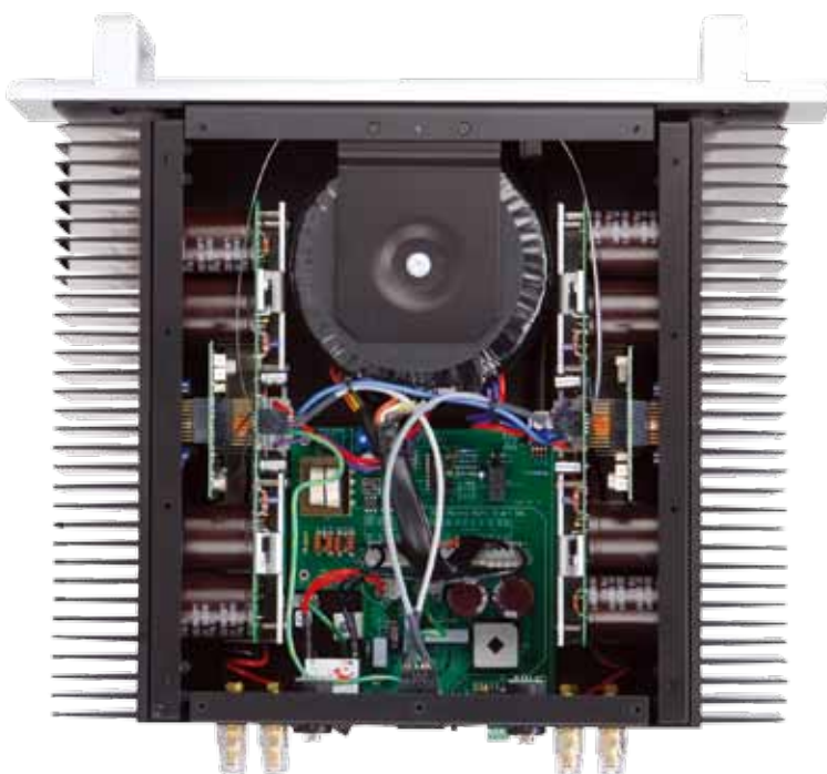
Bryston 28BSST 2

從內部可以看出這次改款的最大不同，整體架構承襲經典，但細節優化了許多，諸如電路版的連接、布局路徑的簡化，以及電源供應強化等，至於影響聲音最大的輸入級，也同樣經過強化。下面的控制與電源電路板經過整合之後，加入了軟開機的保護線路，讓整體的防護效果更好。兩側就是每聲道4對的OnSemi功率晶體，輸出超大的電流與超強的功率，另外可以看到溫度補償晶體上加了強化的鋼板，讓散熱效果更好，聲音表現當然也更加穩定。